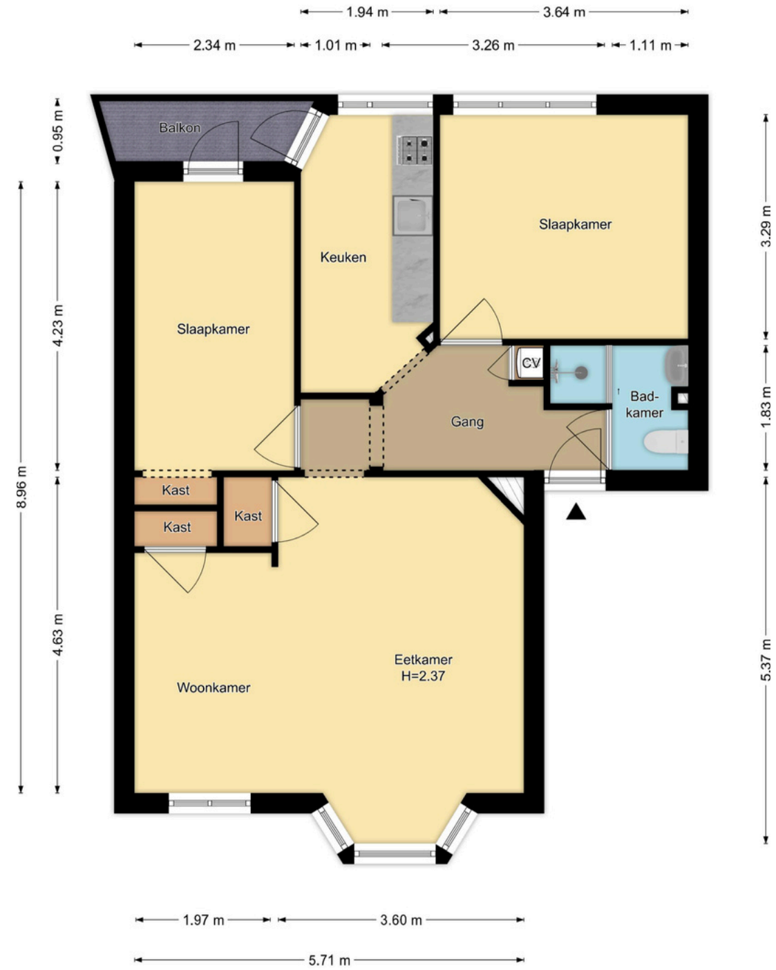
1e Verdieping Cornelis Springerstraat 30-1, Amsterdam

R.M. Vastgoedpresentatie| Aan deze plattegrond kunnen geen rechten worden ontleend