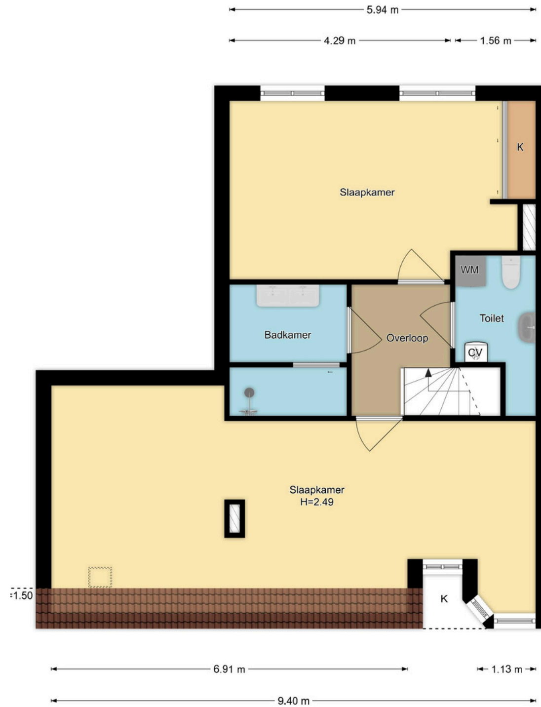
2e Verdieping Blekersvaartweg 12b, Heemstede R.M. Vastgoedpresentatie| Aan deze plattegrond kunnen geen rechten worden ontleend