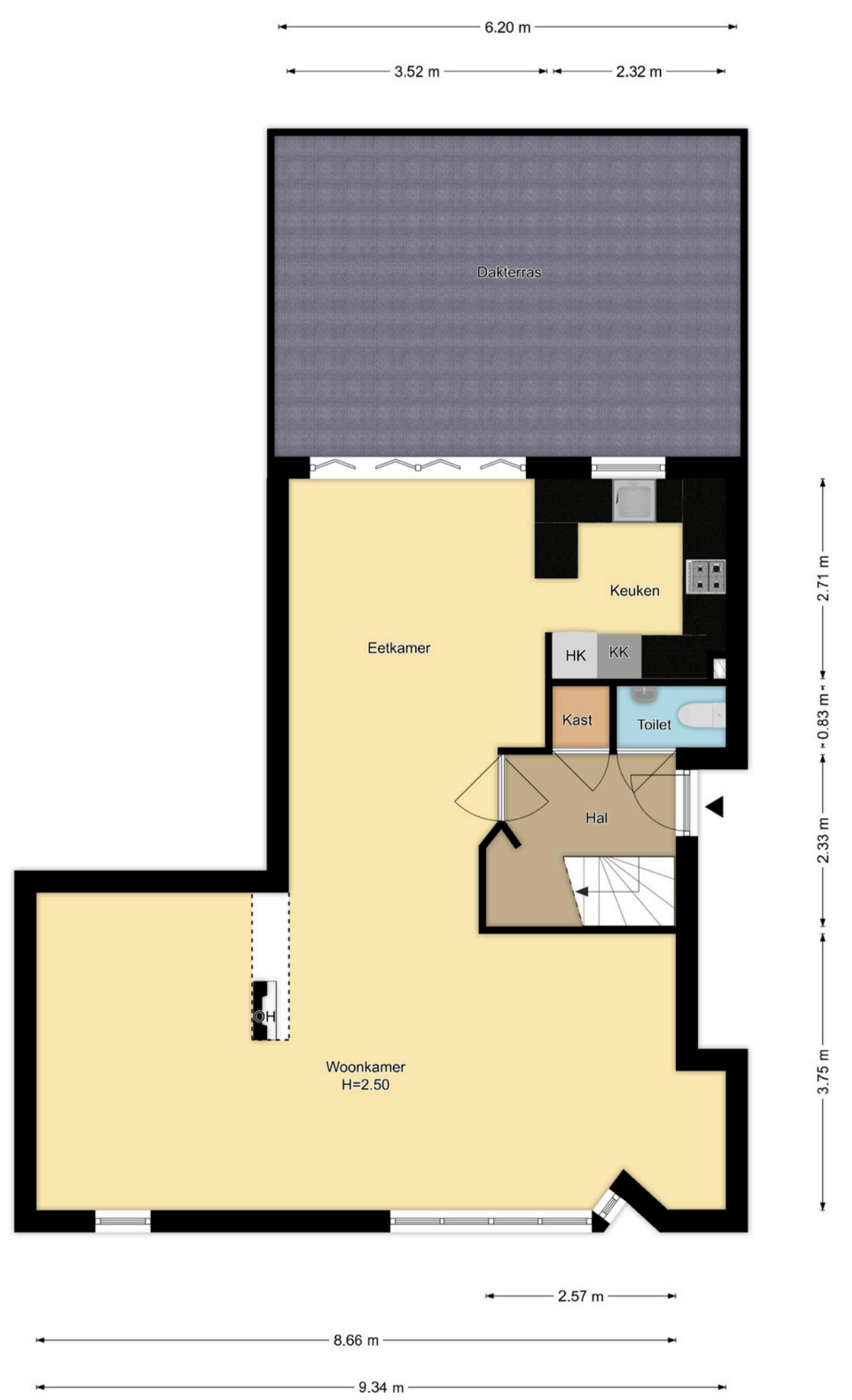
1e Verdieping Blekersvaartweg 12b, Heemstede

R.M. Vastgoedpresentatie| Aan deze plattegrond kunnen geen rechten worden ontleend